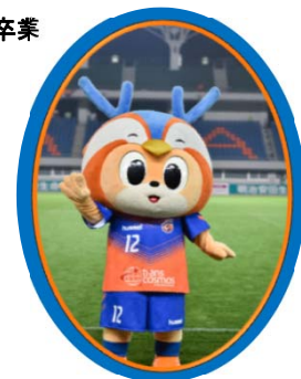
V・ファーレン長崎クラブマスコット ヴィヴィくん

1993年 国立大学法人東京学芸大学教育学部人間科学課生涯スポーツコーチ専修卒業 1993年 東京ガス(株)入社 1994年～98年 東京ガスサッカー部・東京ガスフットボールクラブ 1999年～00年 FC東京U-18コーチ クラブユース選手権出場他 サッカースクールコーチ 2002年 東京ガス(株)退社ならびにFC東京退団 2003年 Jroots Sports International 設立 代表取締役就任 2005年～07年 FC刈谷ゼネラルマネージャー 2011年～12年 FC岐阜ゼネラルマネージャー 2012年～ 中華民国台中市政府体育委員会 中華民国台中市サッカー協会顧問 株式会社 JPLAY MANAGEMENT 設立 代表取締役就任 株式会社 V・ファーレン長崎 強化部 部長 2013年 株式会社 V・ファーレン長崎 ゼネラルマネージャー兼強化部 部長 2014年 株式会社 V・ファーレン長崎 ゼネラルマネージャー兼強化部 部長 2015年～ 株式会社 V・ファーレン長崎 取締役兼ゼネラルマネージャー